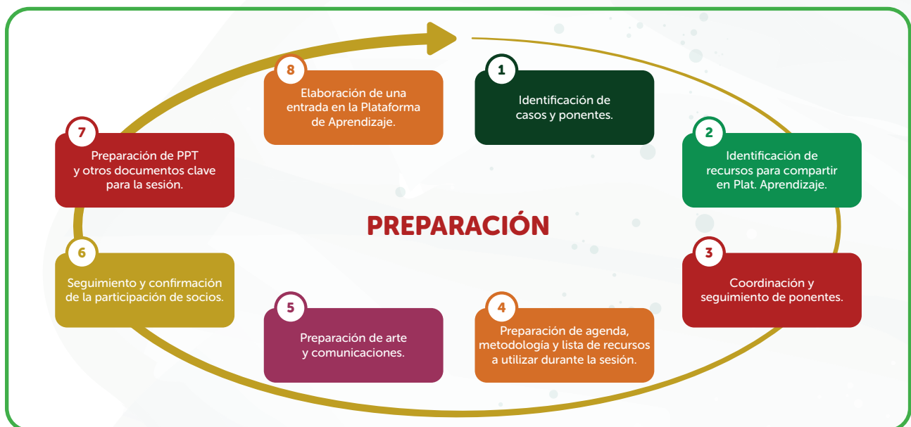
Figura 4: Pasos y flujo para la preparación de las sesiones de la Comunidad de Aprendizaje