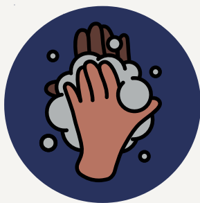
LAVADO CONSTANTE DE MANOS