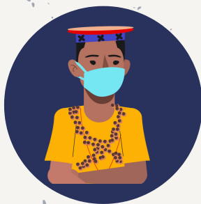
USO DE MASCARILLAS

Por lo tanto, se debe mantener las medidas de prevención frente a la enfermedad: